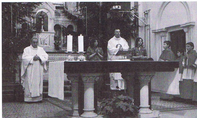
Podczas Mszy Św.