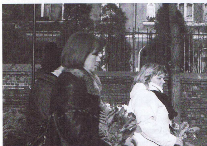
Podczas składania kwiatów