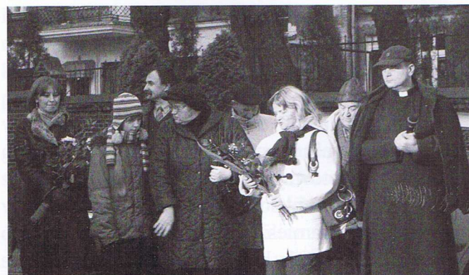
Przedstawiciele Rady Miasta, Rady Osiedla, Parafii MBB