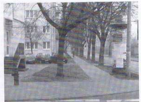
ul. Klauzyny Potockiej (Dmowskiego - Kolejowej)

ul. Bogusławskiego między Stablewskiego a Morawskiego oraz