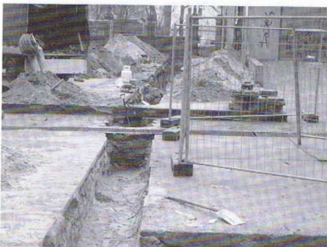
Podłączenie węzła cieplnego na terenie SP-26 przy ul. Berwińskiego.