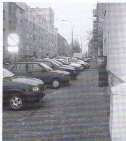
ul. Klaudyny Potockiej (Lodowa - Głogowska).

roku, dzięki inicjatywie i wsparciu finansowemu Rady Osiedla św. Łazarza i ZDM, wyremontowane zostały na osiedlu, następujące ulice: Drużbackiej, Limanowskiego (jedna strona), Potworowskiego, Potockiej, Bogusławskiego, Stablewskiego, Małeckiego, Graniczna, Łukaszewicza, Mottego. W roku 2007 Rada zabezpieczyła środki finansowe na kolejne remonty ulic Bogusławskiego i Załęże. Mamy nadzieję, że stan chodników z roku na rok będzie się dalej poprawiał. Zadnie związane z remontami chodników, jest jednym z najważniejszych w działalności naszej rady. Korzystając z okazji jeszcze