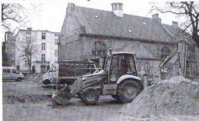
Prace budowlane na terenie SP-26 przy ul. Berwińskiego.

W 2005 i 2006 r. Dalkia zrealizowała sieci w ulicach: Ułańska, Siemiradzkiego, Kossaka (na odcinku od Siemiradzkiego do Wyspiańskiego), Wyspiańskiego, Kasprzaka (Wyspiańskiego-Morawskiego), Drużbackiej, Niegolewskich, Kłownikowa, Limanowskiego (Kłownikowa-Głogowska), Głogowska (Gąsiorowskich-Kanałowa), Gąsiorowskich (wzdłuż bud. Głogowska 31/33), Kanałowa (Głogowska-Ma-