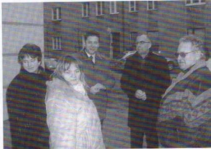
Wizyta na ul. Załęże

obejrzał wyremontowany chodnik przy ulicy Potockiej na odcinku od Lodowej do Kolejowej. Będąc na ulicy Potockiej zaprowadziliśmy naszego gościa na ul. Załęże, która naszym zdaniem wymaga remontu. Na realizację tego zadania Rada Osiedla św. Łazarza zabezpieczyła w swoim przyszłorocznym budżecie kwotę 20.000,- zł. Celowość przeprowadzenia tej inwestycji podkreślił także prezydent Kruszyński. Kolejnym miejscem, które wspólnie